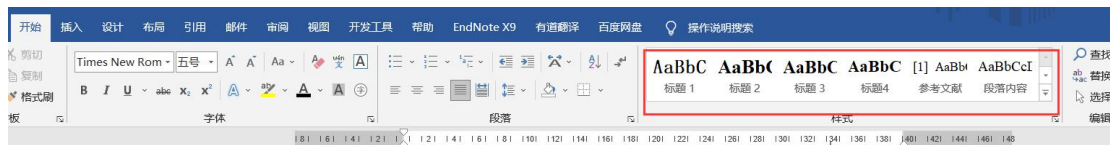
图 2.1 样式的具体说明

正文部分的内容采用样式“段落内容”。标题根据级别选择样式“标题 1”至“标题 4”。此后不对此再赘述。下就 word 中样式的使用简要说明：